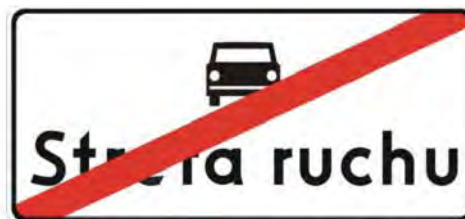
Rys. 5.2.57.1. Znak D-53

Znak D-53 „koniec strefy ruchu” (rys. 5.2.57.1) stosuje się w celu wskazania wyjazdu z drogi wewnętrznej położonej w strefie ruchu. Znak ten umieszcza się na wszystkich wyjazdach ze strefy oznakowanej znakami D-52, w tym samym przekroju poprzecznym drogi co znak D-52. Znak D-53 „koniec strefy ruchu” może być umieszczony po lewej stronie jezdni, na odwrotnej stronie znaku D-52.”;