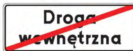
Rys. 5.2.53.1. Znak D-47

Znak D-47 „koniec drogi wewnętrznej” (rys. 5.2.53.1) stosuje się w celu wskazania wjazdu z drogi wewnętrznej na drogę publiczną. Znak ten może być umieszczony po lewej stronie jezdni, na odwrotnej stronie znaku D-46.