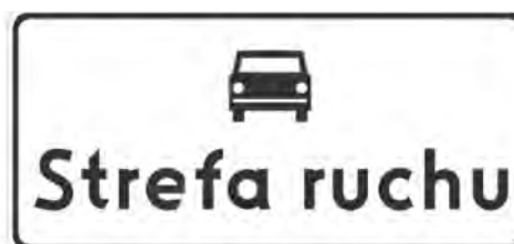
Rys. 5.2.56.1. Znak D-52