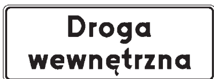
Rys. 5.2.52.1. Znak D-46

Znak D-46 „droga wewnętrzna” (rys. 5.2.52.1) stosuje się w celu wskazania wjazdu na drogę wewnętrzną, w rozumieniu art. 8 ust. 1 ustawy z dnia 21 marca 1985 r. o drogach publicznych (Dz. U. z 2007 r. Nr 19, poz. 115, z późn. zm. 4) ).